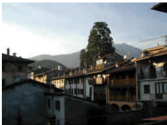
La presenza di alberi monumentali arricchisce il paesaggio